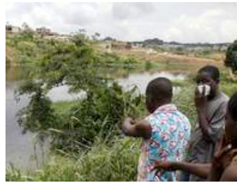
Anwohner eines Sees auf dem Dokoui-Plateau der Elfenbeinküste halten sich wegen des vom Giftmüll ausgehenden Gestanks Taschentücher vor ihre Gesichter.

Noch schlimmer ist die Bleibelastung im peruanischen La Oroya: Angeblich ist sie bis zu 45 Mal höher als normal. Asthma, Bronchialerkrankungen sowie Nieren- und Nervenleiden sind in der Einwohnerschaft weit verbreitet. La Oroya gilt als das Bergbau-Zentrum von Peru. Das Gestein um die Stadt ist durchsetzt mit Blei, Kupfer, Zink und Silber. Die Abwässer der Armen-Hütten sind verseucht, die Abgase mit Blei, Arsen und Cadmium angereichert. Saurer Regen belastet potentielle Anbauflächen genauso wie den Fluss Mantaro, an dem auch die Trinkwasserquellen der Hauptstadt Lima entspringen.