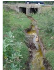
Ranipet, in India: altissimo inquinamento da cromo esavalente