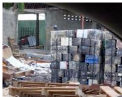
Haina (Repubblica Dominicana). L'ambiente è saturo di piombo

Tre sono in Russia, ma Chernobyl è solo nona. Luoghi in cui l'aspettativa di vita è simile a quella del medioevo in Europa